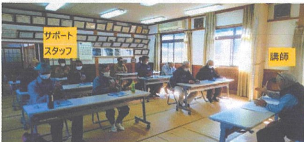
2020/10/31 山南町西谷 10名