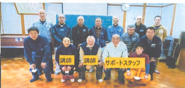
2020/11/1 山南町西谷 10名