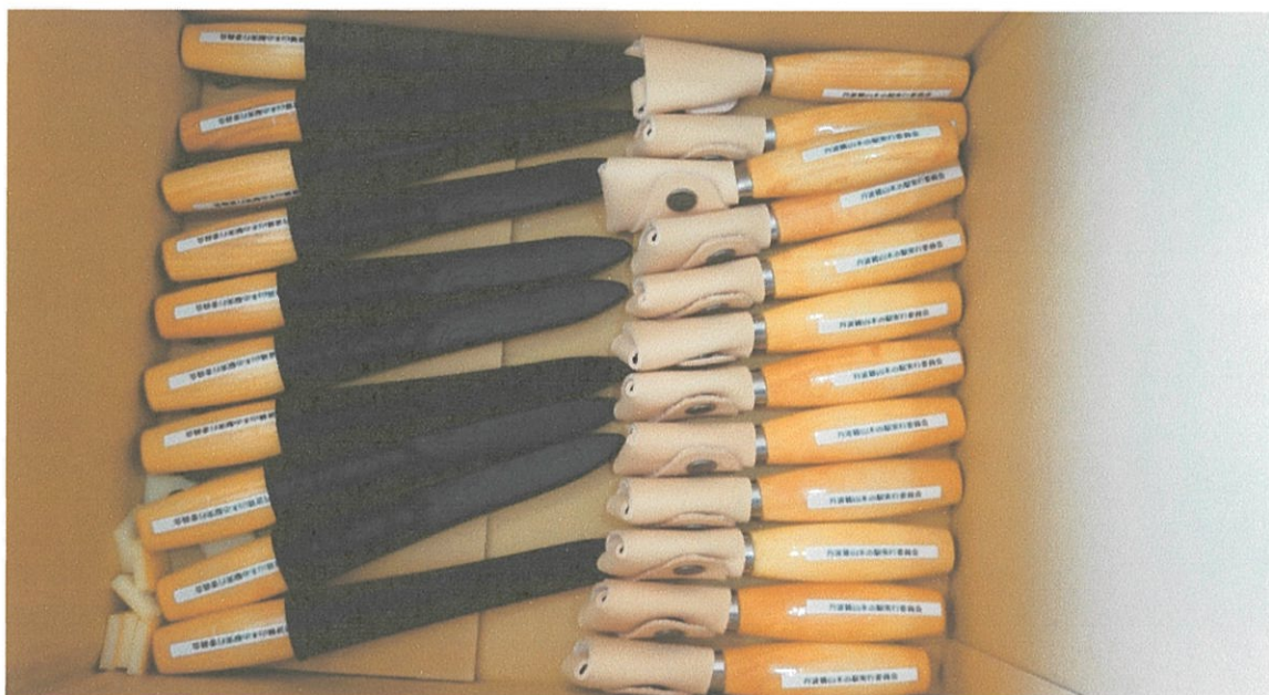
◎左利きフックナイフ2本