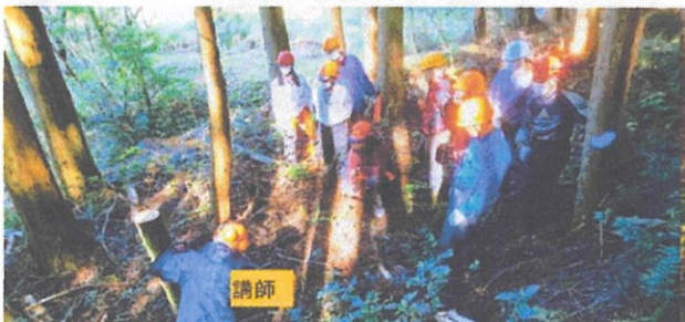
2020/11/22 春日町下三井庄 9名