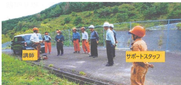
2020/9/20 春日町平松 7名