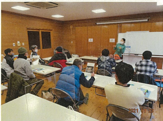
安全講習座学の様子