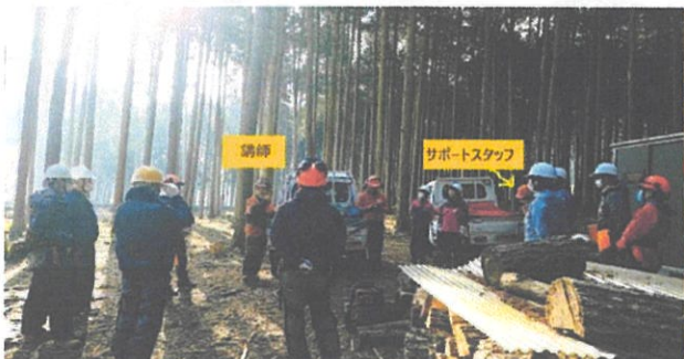
2021/2/13 春日町野村 12名