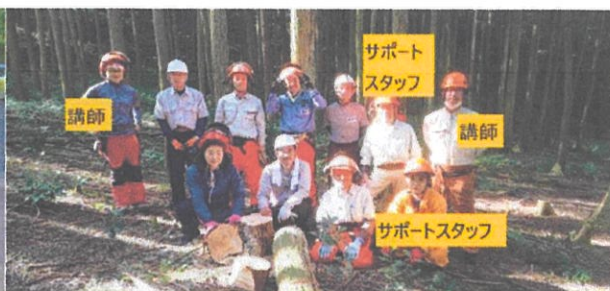
2020/9/21 春日町平松 7名