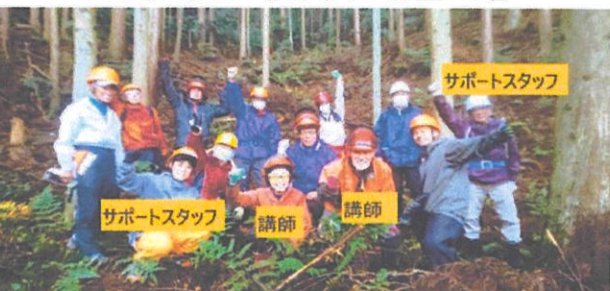
2021/11/23 春日町下三井庄 9名